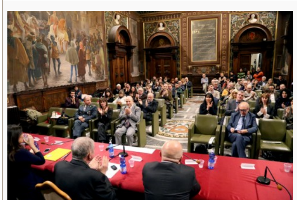
L'incontro nell'aula magna dell'università

L'Università di Macerata promuove la cooperativa sociale, che si è “laureata” ieri pomeriggio nell'Aula Magna dell'ateneo dove un pubblico numeroso si è riunito per assistere alla discussione della “tesi di laurea” intitolata “Comunicazione e sicurezza in Meridiana”. Ospite speciale