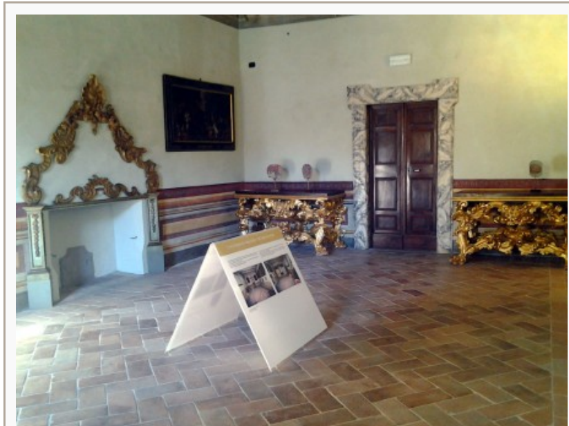
Una delle sale di palazzo Parisani Bezzi

Una giornata dedicata all'educazione alimentare, al disagio scolastico e al divertimento per i più piccoli. È quanto Meridiana sta preparando per i musei civici di Tolentino in occasione della giornata nazionale delle famiglie al museo. Domenica 4 ottobre palazzo Parisani Bezzi e il museo internazionale dell'umorismo nell'arte attendono grandi e piccoli per un giorno dedicato alle famiglie. Si inizia la mattina con un appuntamento rivolto ai temi dell'educazione alimentare, con particolare riferimento alla nutrizione del bambino sportivo