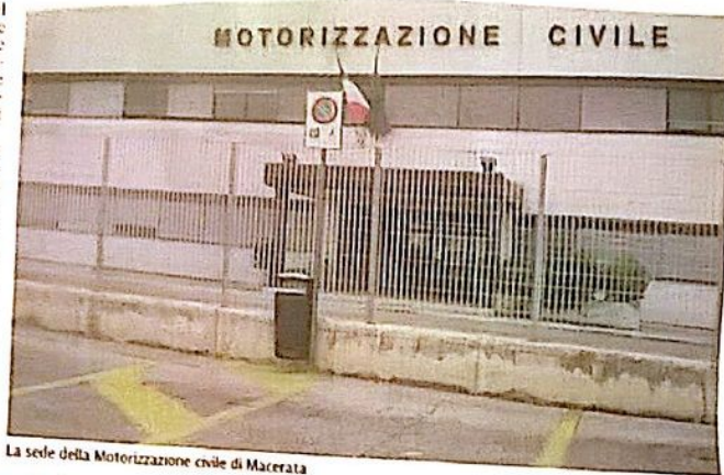
La sede della Motorizzazione civile di Macerata

Uno dei furbetti costretto a ricorrere alle cure dei medici per un problema all'orecchio