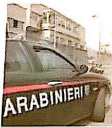
Sono intervenuti i carabinieri

Va a fare l'esame di lingua italiana a posto di un altro. Ma il voto, alla fine, glielo danno i carabinieri: arrestato. L'altro ieri pomeriggio i militari sono intervenuti nella scuola media Enrico Medi. E' lì che si stavano svolgendo le prove di Italiano che consentono il rilascio agli extracomunitari del permesso di soggiorno di lungo periodo. Al test si è presentato un uomo, un senegalese di 44 anni. Ma quando